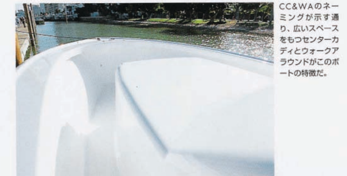
CC&WAのネーミングが示す通り、広いスペースをもつセンターカディとウォークアラウンドがこのボートの特徴だ。