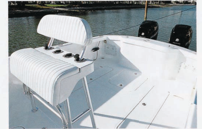
通常のセンターコンソラーとは違いヘルムシートの後方にロッドホルダービルトインタイプのパッセンジャーシートが備わる。

取り回しの楽なサイズ、ジャレットベイだけが持つ独特な雰囲気とスタイル、ボートサイズの大小には関係なく所有する喜びと満足感を得られるスポーツフィッシャーマン、それが「JARRETT BAY 32' CC&WA EXPRESS」なのだ。PB。